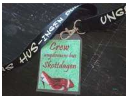
göra bakgrund till film