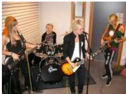
något att säga