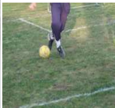
och spela fotboll