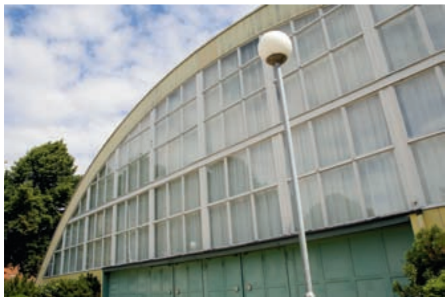
Sporhallen Bollen är ett tidstypiskt byggnadsverk från 1936 som anses värt att bevara.

Projektet är ett samarbete med Riksantikvarieämbetet och Boverket, och finansieras delvis av EU som en del av