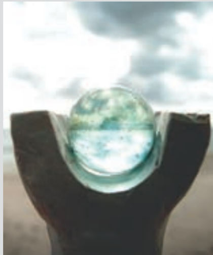
Etthundra skulpturer av Kulturkompaniet i Västra Nöbbelöv kommer att blicka ut över havet i småbåtshamnen.

Fyra Hörn har lagt stor tonvikt vid ungdomarnas situation. Tillsammans har man skapat ett ungdomsråd med representanter från skolorna i regio-