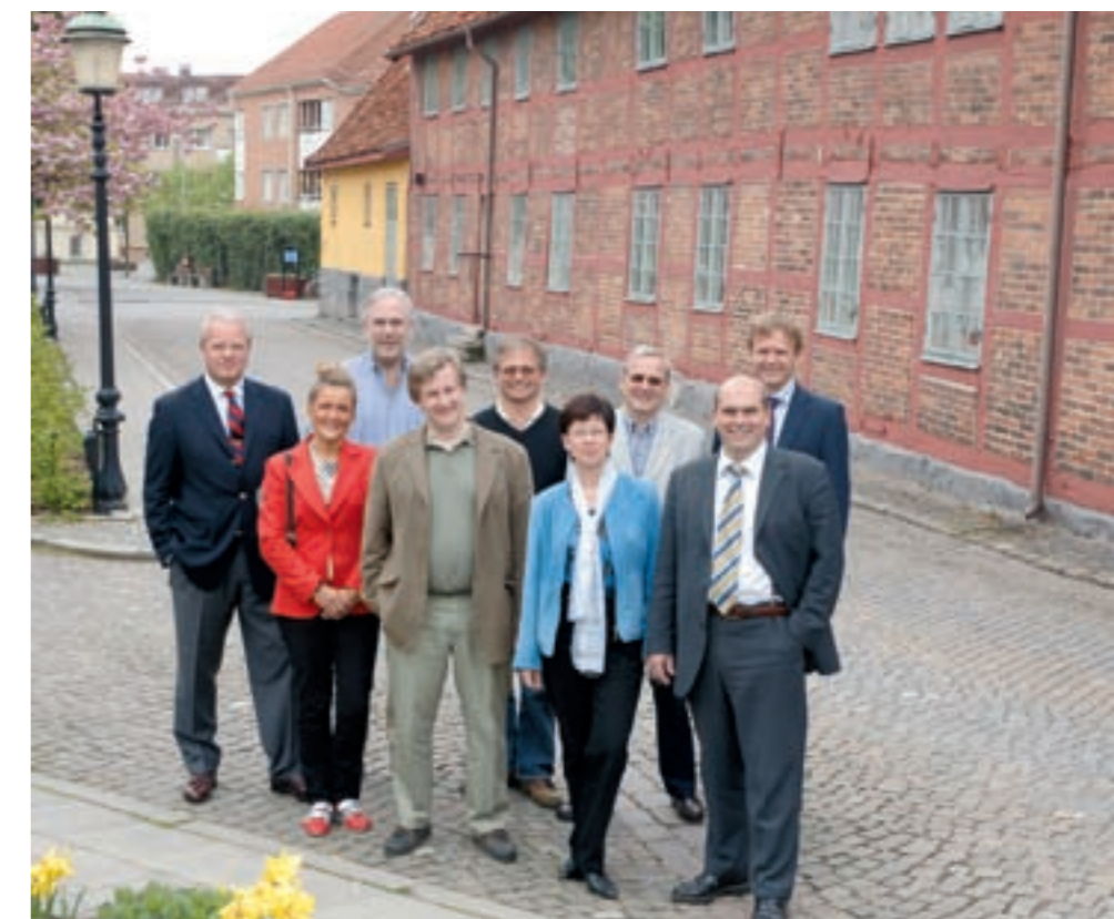
Näringslivsrådet i Ystad arbetar för ett framgångsrikt näringsliv. Rådet består av både företagare och tjänstemän i kommunen.