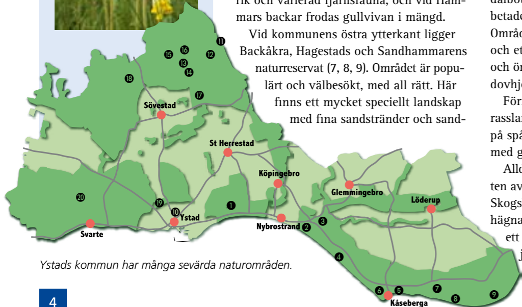
Ystads kommun har många sevärda naturområden.