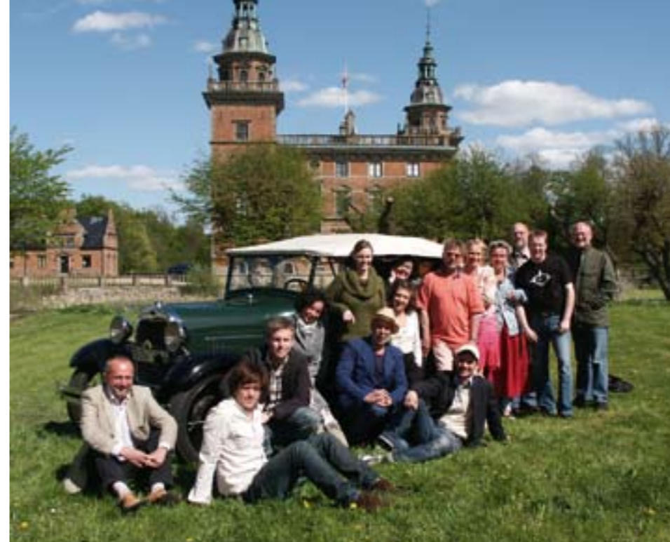
Årets ensemble samlad.

Slottsteatern i Marsvinsholms slottspark, Marsvinsholm Nästa!, har på kort tid blivit tradition i Ystad varje sommar.