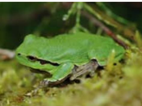
Den sällsynta lövgrodan finns att skåda i norra delen av Ystad kommun, tillsammans med klockgroda och ett stort antal fågelarter.

Med lite planering går det utmärkt att ta bussen till de olika platserna. Kartor och mer information finns att hämta på Ystads turistbyrå