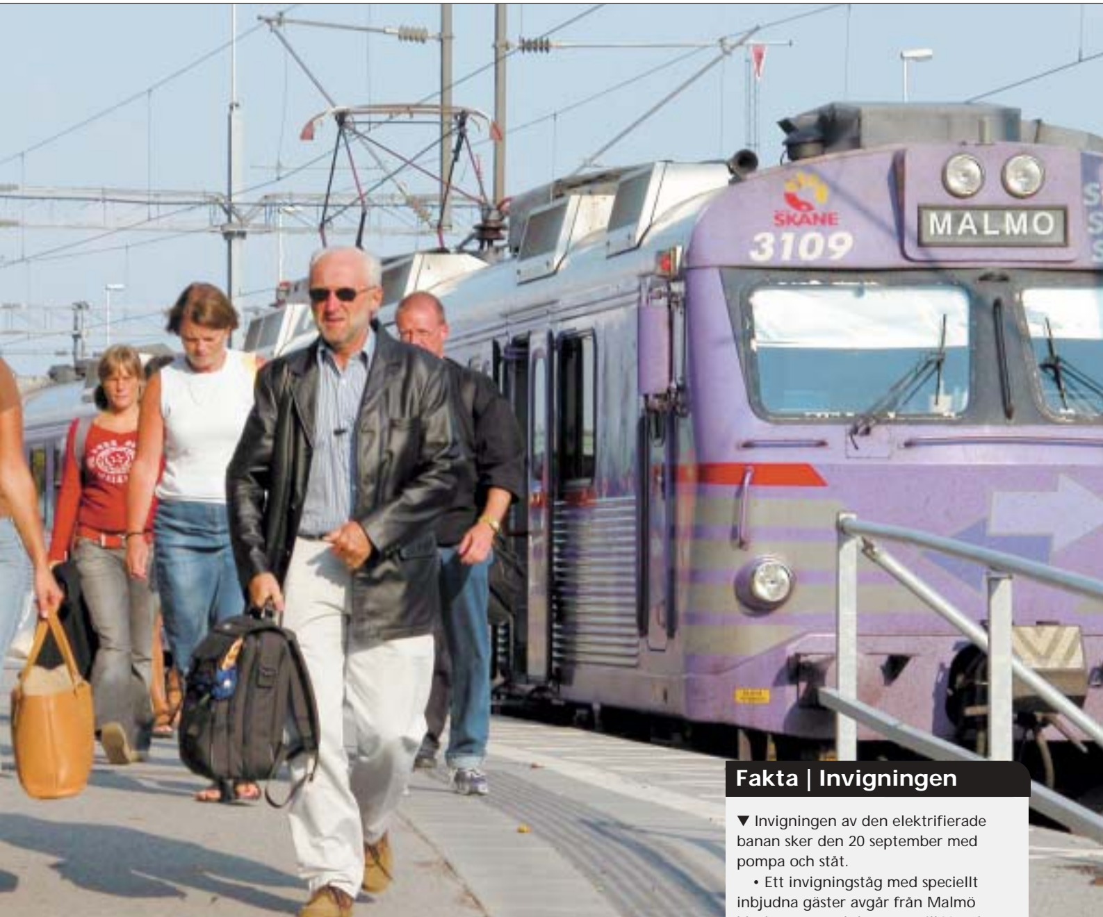
Östertåg ökat av resande när Österlen och Malmö nu får ännu bättre tågförbindelser.

Dammen tömd. Klosterdammen har nu blivit ordentligt rensad från slam och den konstgjorda ön mitt i dammen har renoverats. Det här är ett arbete som genomförs vart tionde år.