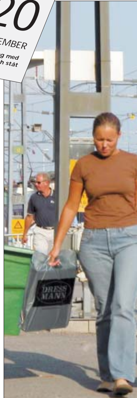
På Skånetrafiken räknar man med ett kraftigt

Kommunerna i sydost och Skånetrafiken har betalt hälften var av 13 miljoner kronor till stationsmiljöbyggnader. Skånetrafiken satsar 2,2 miljoner kronor på biljettutrustning och sätter in tre Pågatåg, värda cirka 60 miljoner