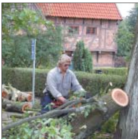
Nu sågas almarna ner efter att ha drabbats av almsjukan.

Den prunkande grönskan kring Klostret och Klosterdammen upp mot Hospitalsgatan är snart bara en minne blott. Även de resliga almarna i Norra Promenaden har sett sina bästa dagar.