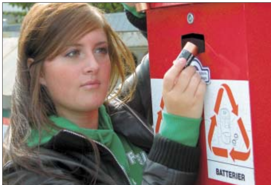
Ystadborna har på ett år blivit dubbelt så bra på att lämna in gamla urladdade batterier.

På ett halvår har lämnats in lika många batterier som under hela förra året