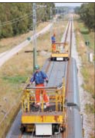
Drygt en kvarts miljard har det kostat att rusta upp banan mellan Ystad och Simrishamn.