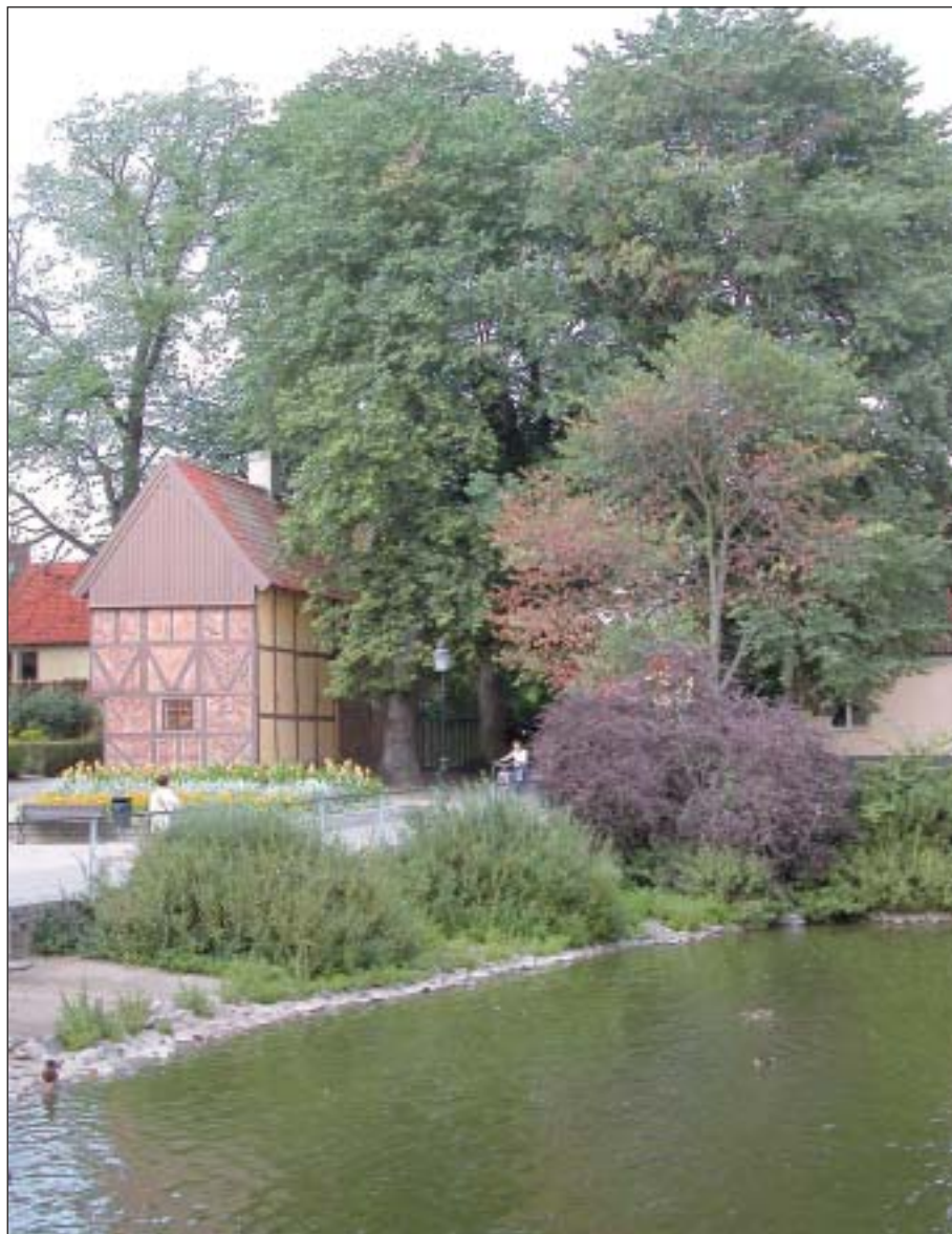
Passa på att njuta av bilden för snart är de resliga almarna vid Klosterdammen borta.