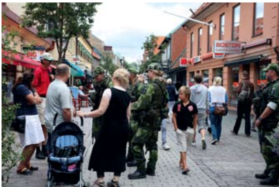
I maj kommer Ystad att vara övningplats för en militär storövning, den sista någonsin med värnpliktiga soldater.

Ystad och Köpingsbro kommer att utgöra övningsområden för strid i stad, samtidigt som man också kommer att röra sig i landskapet på större områden. Soldaterna kommer att möta en allmänhet som de inte vet är vänligt sinnad,