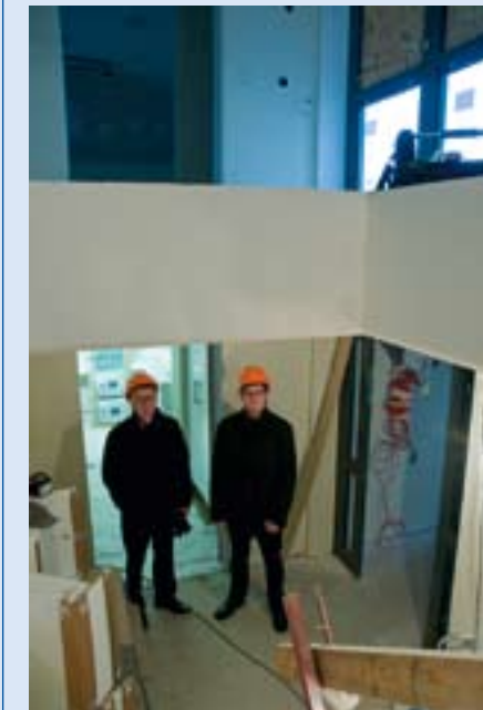
Nu invigs gruppboendet på Pantzargatan som byggdes under bintern 2009/2010 på uppdrag av Ystadbostäder.

Den 15 februari invigdes gruppboendestaden Pantzargatan 33 A, ett gruppboende som vänder sig till personer med psykiska funktionsnedsättningar och som behöver tillgång till personalstöd i boende och vardag. Gruppboendet är integrerat i det nya bostadsområdet i kv. Tankbåten, strax väster om Ystads centrum, som byggts av AB Ystadbostäder. Området ligger nära till havet och med gångavstånd till Norra Promenaden och centrum. Genom att öppna Pantzargatan 33 A kan Ystads kommun erbjuda invånare med omfattande psykiska svårigheter ett kvalificerat boende med service i sin hemkommun i stället för att som hittills, erbjuda lösningar i form av boende på enskilda vårdhem, ofta i andra kommuner. Detta innebär att de flesta boende har kunna "flytta hem" till en egen bostad efter att under kortare eller längre tid ha bott på olika vårdhem. Personalen, eller handledarna, som arbetar i gruppboendestaden har utbildning i och erfarenhet av att bemöta personer med psykiska funktionsnedsättningar. För att få en bostad på Pantzargatan 33 A krävs en så kallad behovsbedömning, dvs. en ansökan och biståndsbeslut enligt Lag om Stöd och Service – LSS, eller Socialtjänstlagen – SoL.