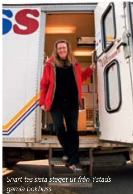
Snart tas sista steget ut från Ystads gamla bokbuss.

Bokbussen kommer precis som tidigare att ha fokus på litteratur och media för barn- och ungdom, då 8.000 av de